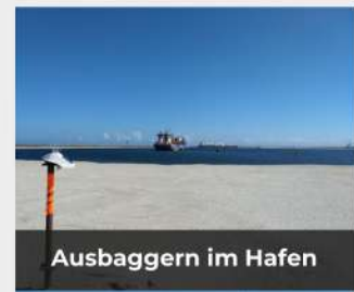
Ausbaggern im Hafen